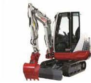
Výkopové a stavebné práce/ Ausgrabungs - und Bauarbeiten