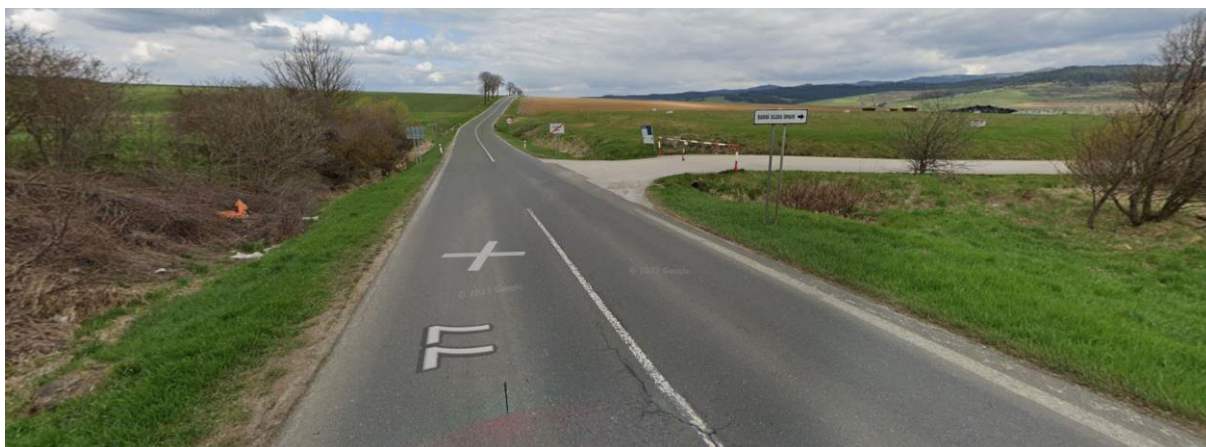
Pohľad z cesty I/77 na územie rekultivovanej skládky a čiastočne pôvodnej mokrade.