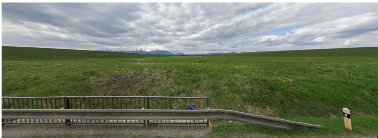
Pohľad z cesty I/77 na územie pôvodnej mokrade.

Lokálna mokraď na opačnej strane cesty I/77 (smer Bušovce) ako je rekultivovaná a jestvujúca skládka TKO je v súčasnosti nefunkčná a využívaná je ako TTP. Preto ju v grafickej časti (vid'.: v.č. 3) navrhujeme na zrušenie.