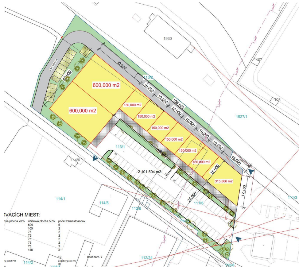
Situácia - zastavovacia štúdia.