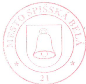
Jozef Kuna primátor mesta

5./ Toto nariadenie nadobúda účinnosť 15. dňom od jeho zverejnenia.