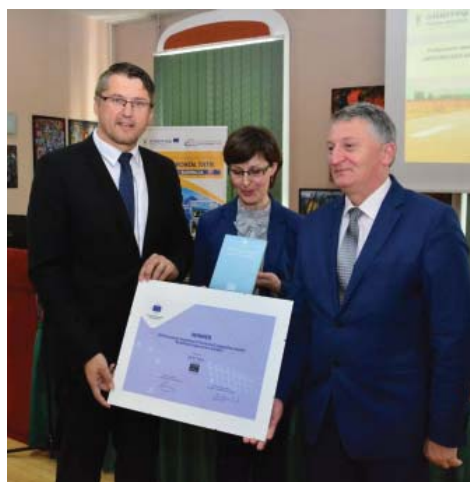
• EZUS TATRY získal celoeurópske ocenenie Výboru regiónov.