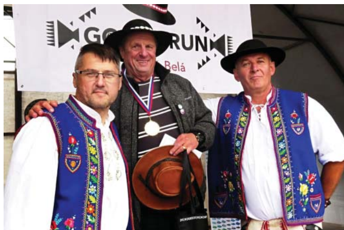
• Bežecké podujatie Goral run prilákalo pod Tatry viac ako 400 účastníkov všetkých vekových kategórií nielen z blízkeho okolia, ale aj zo vzdialenejších kútov Slovenska.