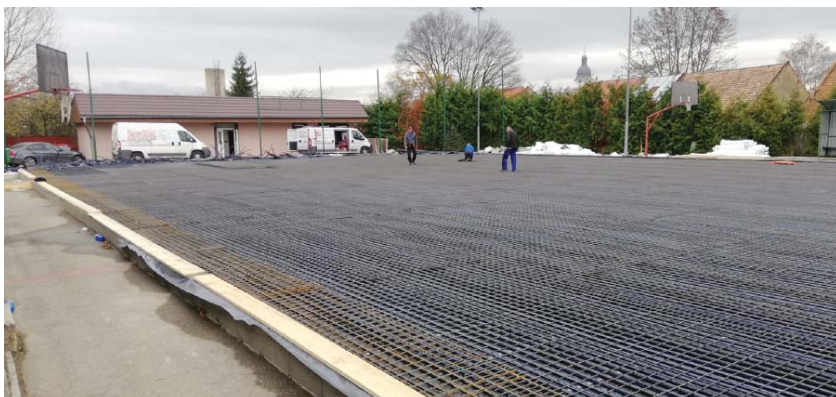
• Výstavba nového hokejbalového areálu na Tatranskej ul. aj s chladením pre ľadovú plochu.