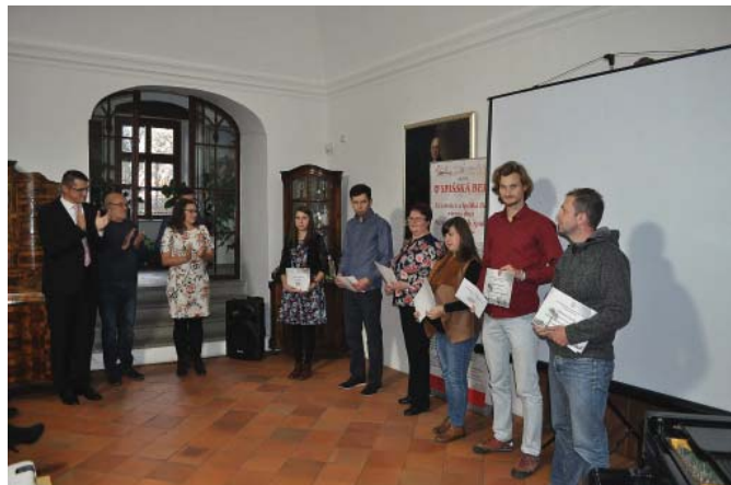
• Počas inaugurácie novej knihy o Spišskej Belej sa uskutočnilo aj vyhodnotenie fotografickej súťaže Spišská Belá v 4 ročných obdobiach.