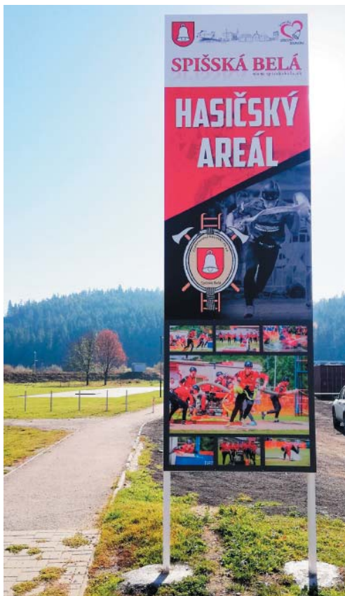
• Nový hasičský areál už slúži členom nášho DHZ.