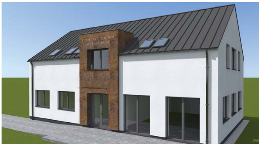
• Plánované Komunitné centrum v Spišskej Belej.