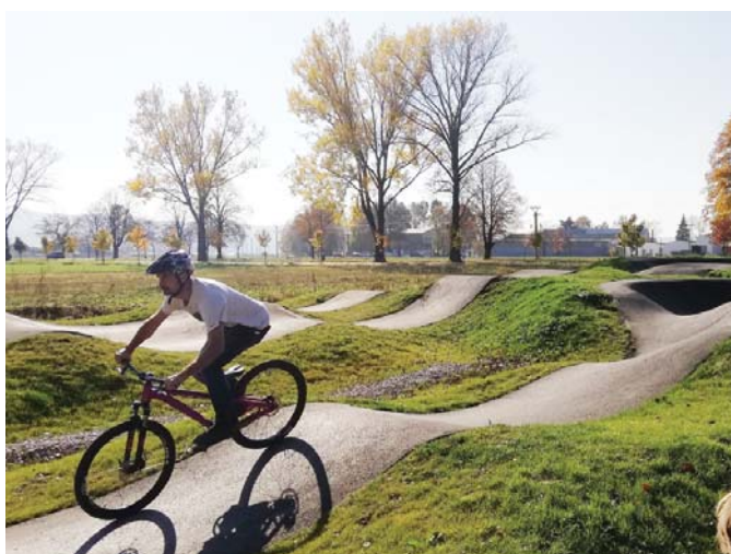
• V novom bike parku sa uskutočnili cyklistické preteky.