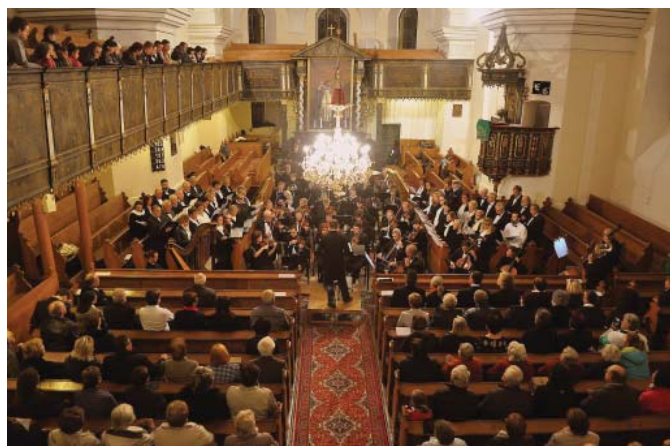
• V Spišskej Belej sa uskutočnil hudobný koncert s názvom „Pocta českej opere“ pri príležitosti 100. výročia vzniku 1. Československej republiky v priestoroch evanjelického kostola.