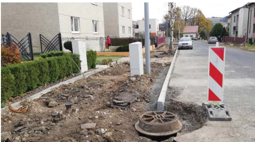
• Výstavba nového chodníka na Krátkej ulici.