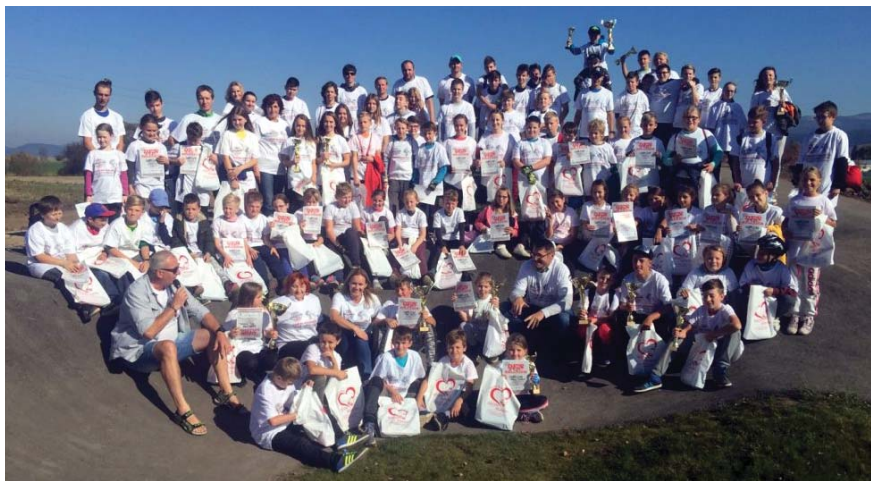
• Spišskej Belej v areáli Bike parku s pumptrackovou dráhou pri Belianskom rybníku uskutočnilo športové podujatie „DEŇ NA KOLESÁCH“.