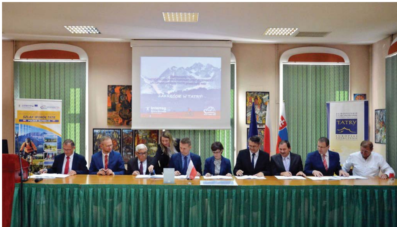
• V poľskom Nowom Targu slávnostne podpísaná Zmluva o partnerstve na realizáciu projektu na výstavbu cyklotrás v rámci projektu „Historicko-prírodno-kultúrna cesta okolo Tatier“ – označená ako 3. etapa.