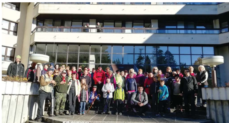
• V októbri sa za krásneho slnečného počasia uskutočnil už tradičný Beliansky turistický pochod na vysokohorskú chatu Plesnivec.