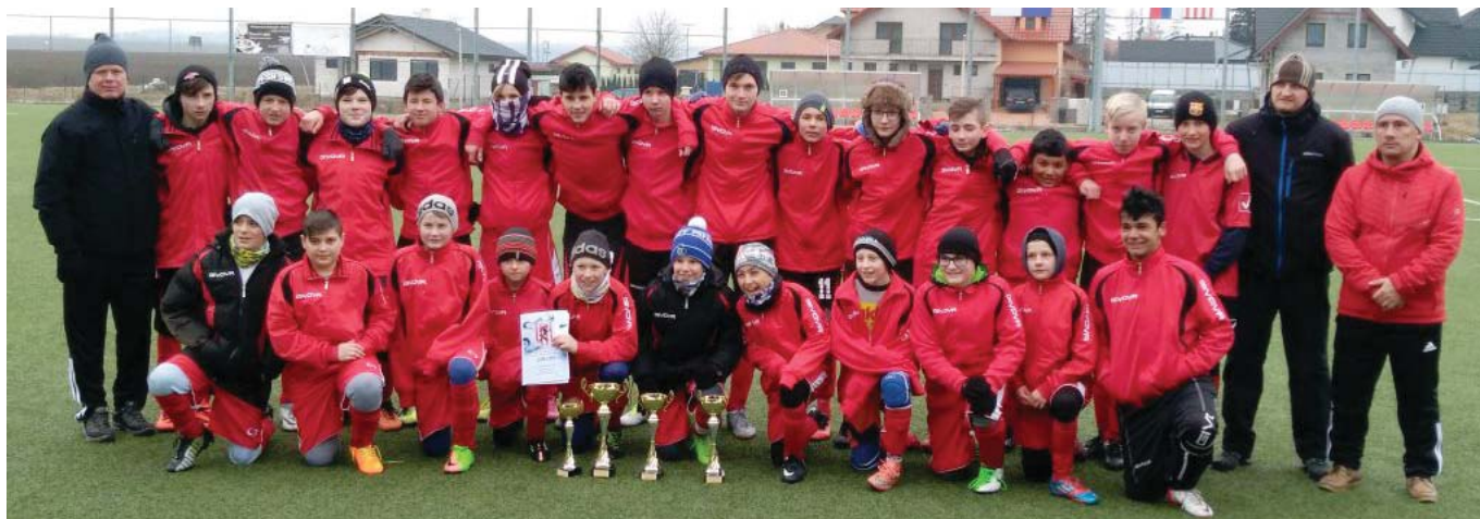
• V marci napísal svoju už deviatu časť Memoriál Lubomira Mačugu , ktorý je už tradične vyvrcholením zimnej prípravy. Turnaj je spomienkou na bývalého dlhoročného trénera mládeže.