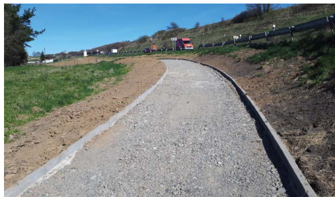
• Koncom apríla sa uskutočnil kontrolný deň na výstavbe cyklotrasy v Strážkach a z Tatranskej Kotliny v smere na Ždiar. Termín dokončenia výstavby podľa zmluvy (koniec júna 2018) bude podľa vyjadrenia zhotoviteľa dodržaný. Úseky, ktoré sa majú asfaltovať, by sa mali vyasfaltovať už do konca mája, nakoľko tie sú už takmer hotové.