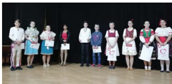
• Aj tento rok sa v Spišskej Belej konala žiacka spevácka súťaž ľudových piesní Beliansky slávik. Bolo viditeľné i počuteľné, že súťaž pre nich nebola len "povinná jazda", ale to, čo na javisku prezentovali a interpretovali, je pevnou súčasťou ich každodenného života.