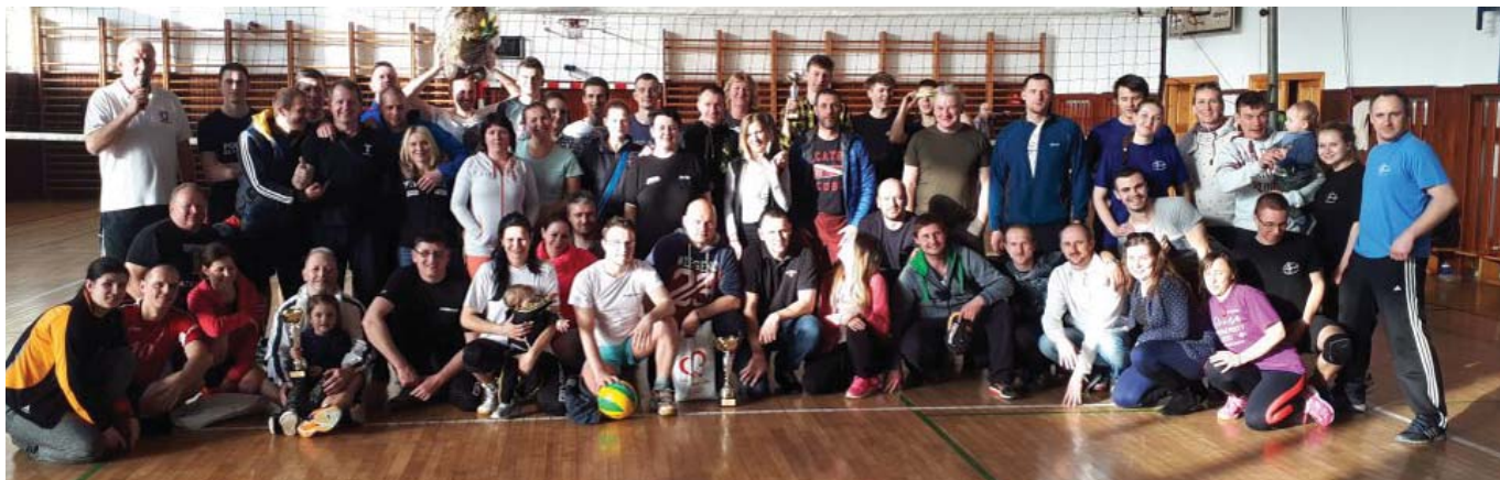
• Tradičný veľkonočný volejbalový turnaj vyhrala Szczawnica.