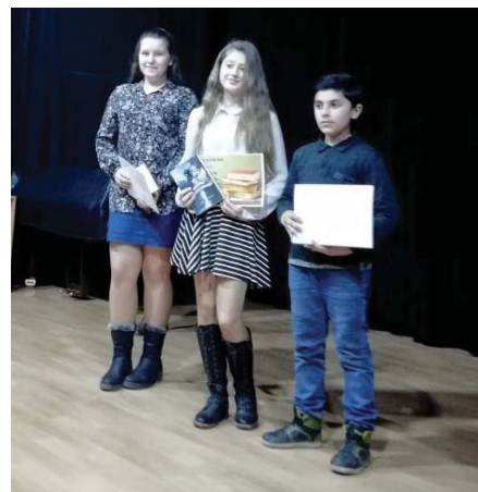
• V literárnej súťaži Slovenčina moja, krásne ty zouky máš , ktorej cieľom je upevniť vzťah našich najmenších k slovenskej literatúre súčasnosti i minulosti sa nám predstavili žiaci zo Spišskej Belej a okolia.