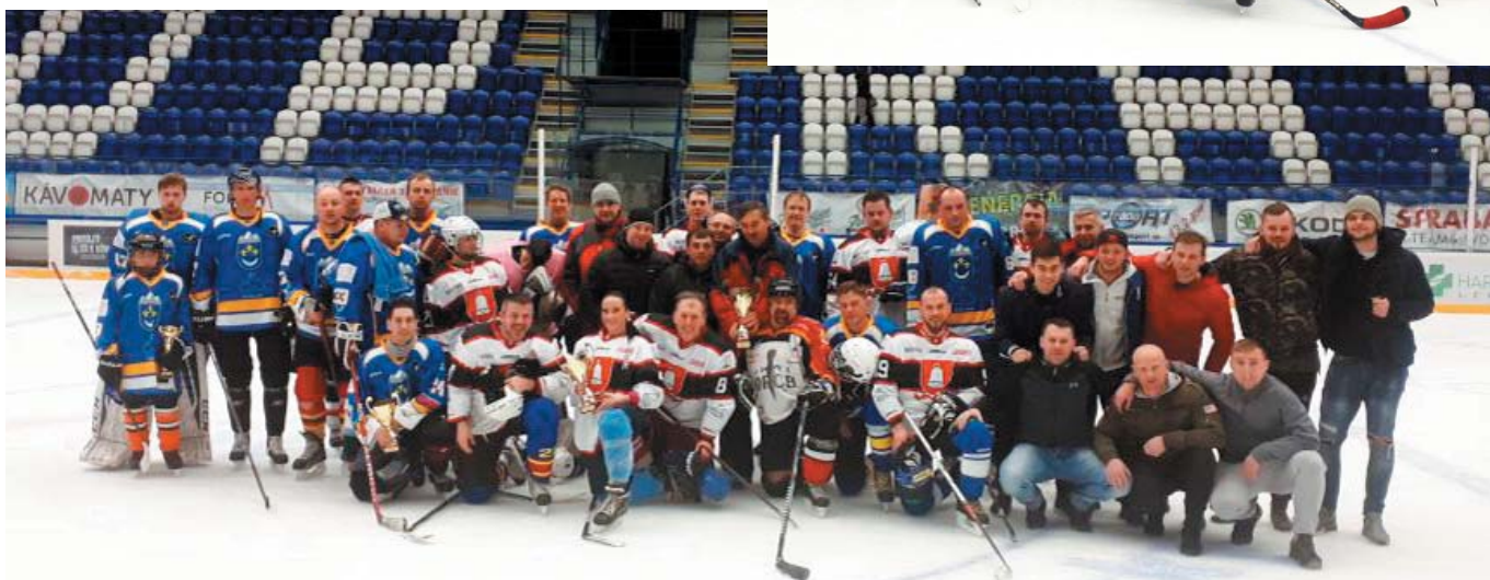
• Koncom marca sa na hokejovom štadióne v Poprade uskutočnil Hokejový turnaj o Pohár primátora mesta Spišská Belá.