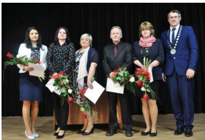
• Mesto si aj tento rok uctilo všetkých učiteľov, ktorí buď stále aktívne pôsobia v našich belianskych školách alebo v nich pôsobili v minulosti.