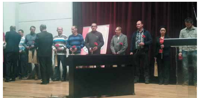
• Slovenský Čerovený kríž odovzdal 23. novembra ocenenie humánosti a šľachetnosti 17 obyvateľom Mesta Spišská Belá