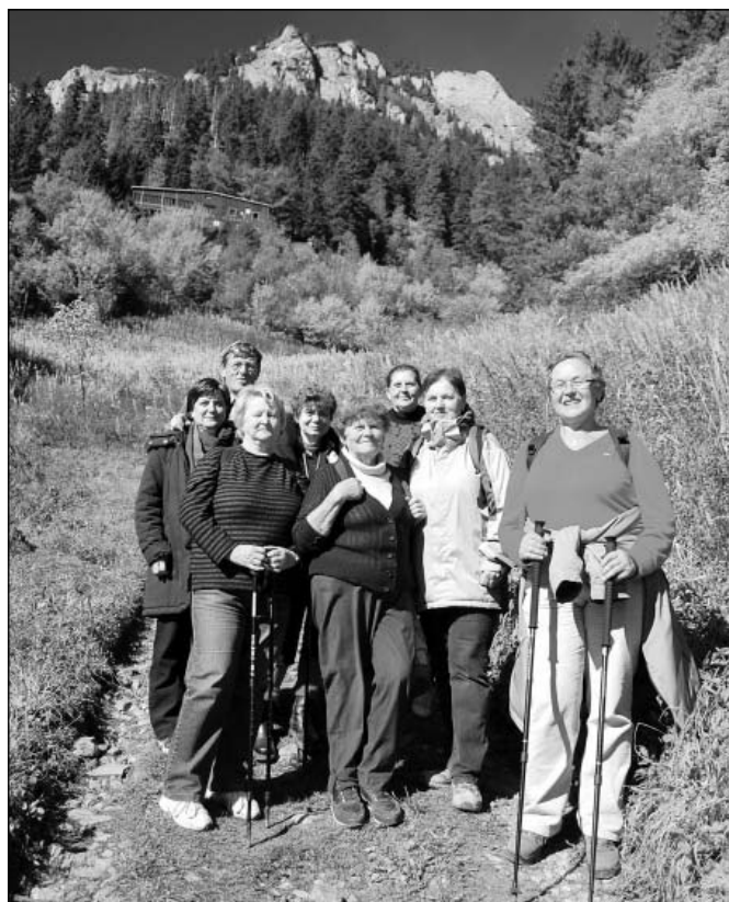
● Účastníci Belianskeho turistického pochodu pod chatou Plesnivec.