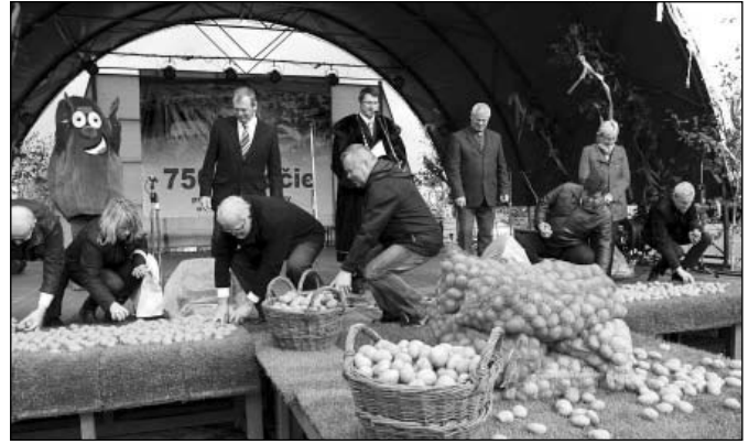
• Hlavní usporiadatelia jarmoku zbierajú svoju úrodu.