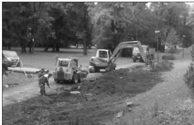
• Mesto realizovalo výstavbu spláškovej kanalizácie v kaštieli Strážky, ktorý sa na ňu napojil.

stavebne opraviť. Tieto práce sa ukončia do konca novembra 2013. V samotnej Spišskej Belej je potrebné zrealizovať ešte cca 800 m spláškovej kanalizácie v lokalite medzi jarkami (na Letnej ulici) popri Belianskom potoku (po oboch jeho stranách). Práce boli časovo odložené z dôvodu čakania na prípravu koryta potoka a uloženie najprv regulácie, kde popri nej bude následne uložené aj kanalizačné potrubie. Tieto práce budú ukončené do konca tohto roka.