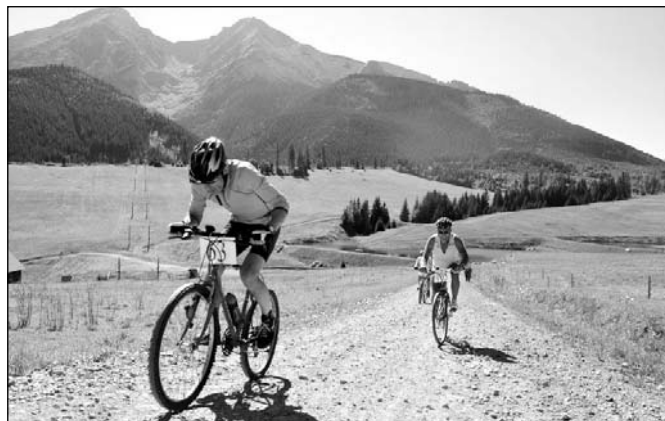
● Pretekári na trati Belianskej 25-tky. Cyklomaratón medzi Spišskou Belou a Ždiarom sa uskutočnil 8. septembra 2013.