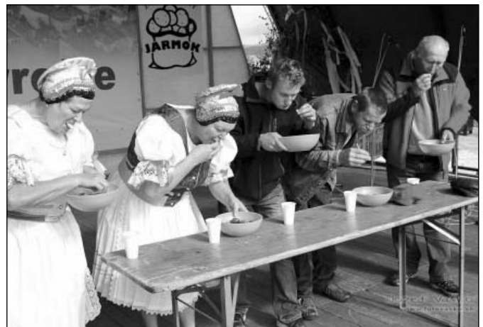
• Veľkému záujmu sa teší ak súťaž v jedení zemiakov.