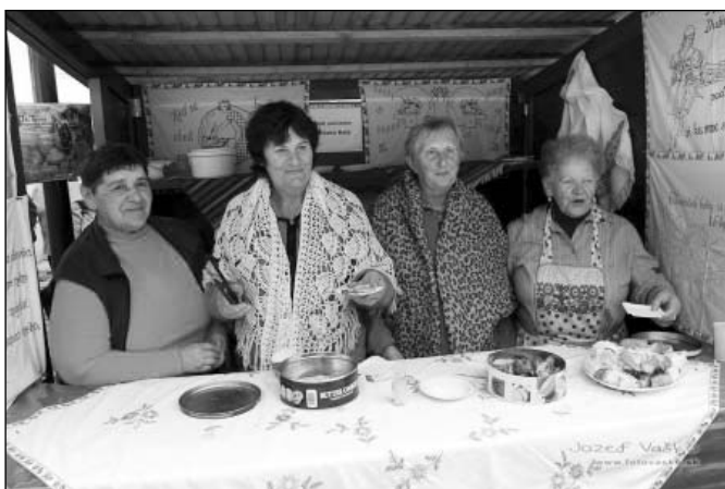
• Členky domáceho klubu seniorov ponúkali zemiakové špeciality.