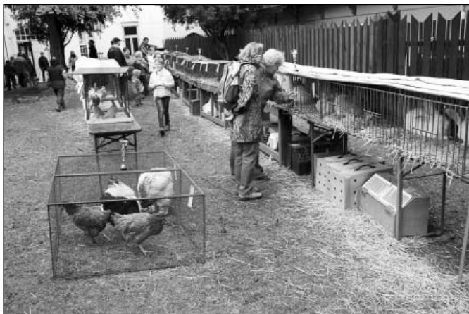
• Sprievodnou akciou jarmoku bola aj Výstava zvierat drobnochovateľov, ktorá bola v priestoroch záhrady Mestskej knižnice.