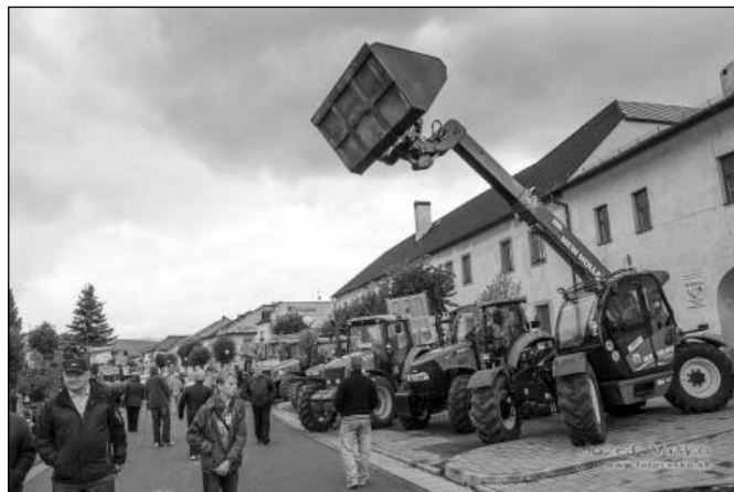
• Spoločnosť AT TATRY, s. r. o., prezentovala svoju novú techniku.