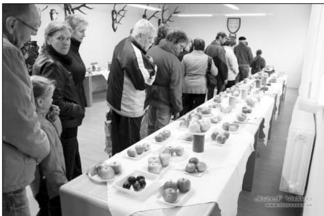
• Sprievodnou akciou jarmoku bola Výstava ovocia a zeleniny okresných záhradkárov z okresu Kežmarok a Poprad, ktorá bola v priestoroch AT TATRY na Petzvalovej ulici.