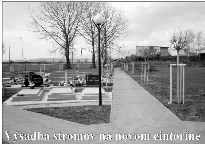
Výsadba stromov na novom cintoríne

né prostredie neboli vznesené žiadne zásadné pripomienky od prítomných osôb. A to aj vzhľadom na to, že samotný proces posúdenia týchto možných negatívnych vplyvov bol urobený kvalifikovane a trval viac ako 1 rok a na jeho základe sa z celkovo navrhovaných 29 trás nedoporučuje realizovať 8 trás turistických chodníkov.