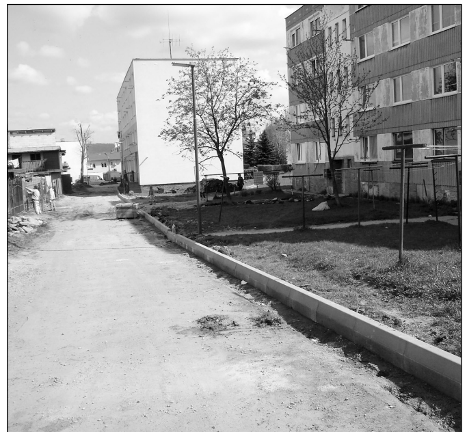
• V súčasnosti prebieha plánovaná oprava mestskej komunikácie na Družstevnej ulici za panelákmi, v rámci ktorej sa osadia nové obrubníky a položí sa nový asfalt.

TANAP-om a Národnou prírodnou rezerváciou Belianske Tatry. Prítomní starostovia obce Ždiar a Tatranská Javorina poukázali na prejazd kamiónov zakázaným úsekom po vstupe SR do Schengenu (po zrušení hraničných kontrol na hraničných priechodoch). Jednoducho povedané, nemá im kto fyzicky zabrániť prejazd týmto úsekom štátnej cesty. Na uvedenom úseku je v súčasnosti zakázaný prejazd medzinárodnej kamiónovej dopravy TIR nad 7,5 tony (s výnimkou dopravnej obsluhy). A práve tento zákaz vodiči kamiónov úmyselne porušujú, nakoľko na hraničnom priechode (Pokračovanie na 2. strane)