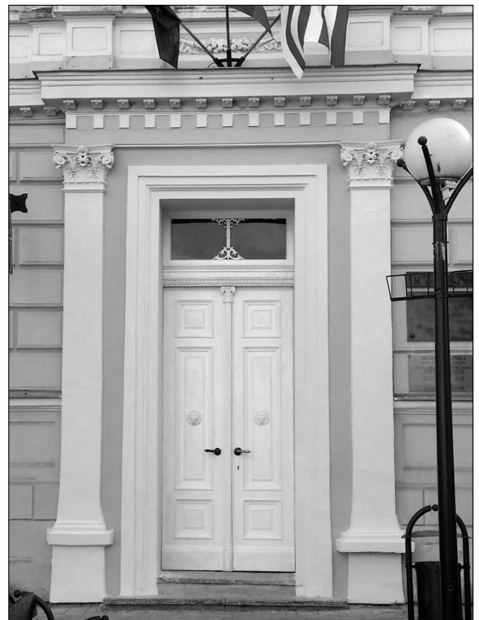
• Začiatkom mája 2015 mesto opravilo vstup do budovy Mestskej knižnice v našom meste.

aj na schodoch). Poďakovanie patrí všetkým týmto deťom za ich šikovnosť a talent, pedagógom za ich trezivosť a ich čas pri príprave detí na dnešné podujatie. Vzdať úctu a vďačnosť všetkým mamičkám, mamkám, maminám možno rôznym spôsobom, napríklad darovaním kytice, darčeka, návštevou či spomienkou, alebo milým slovom, či takým jednoduchým „mami, ďakujem“. A to každý deň, nielen v 2. májovú nedeľu.