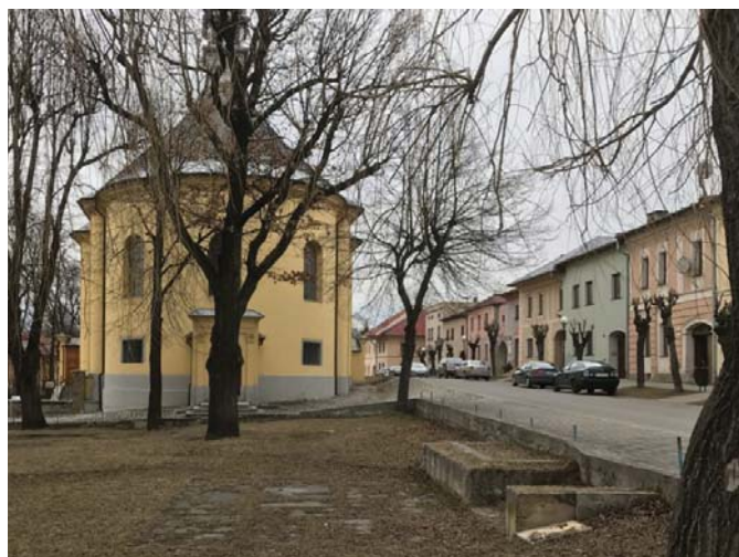
• Park s pôvodným podstavcom v súčasnosti.

Sbierka povolená krajským úradom v Bratislave pod č. j. 1944/8/1936. zo dňa 14. apríla 1936 s časovým vymedzením do 31. decembra 1936 len na území Slovenska.