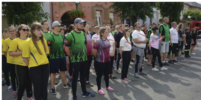
• Nedeľňajší program Dní mesta otvorili hasičské preteky družstiev o Pohár primátora mesta. Náš beliansky tím zvíťazil!