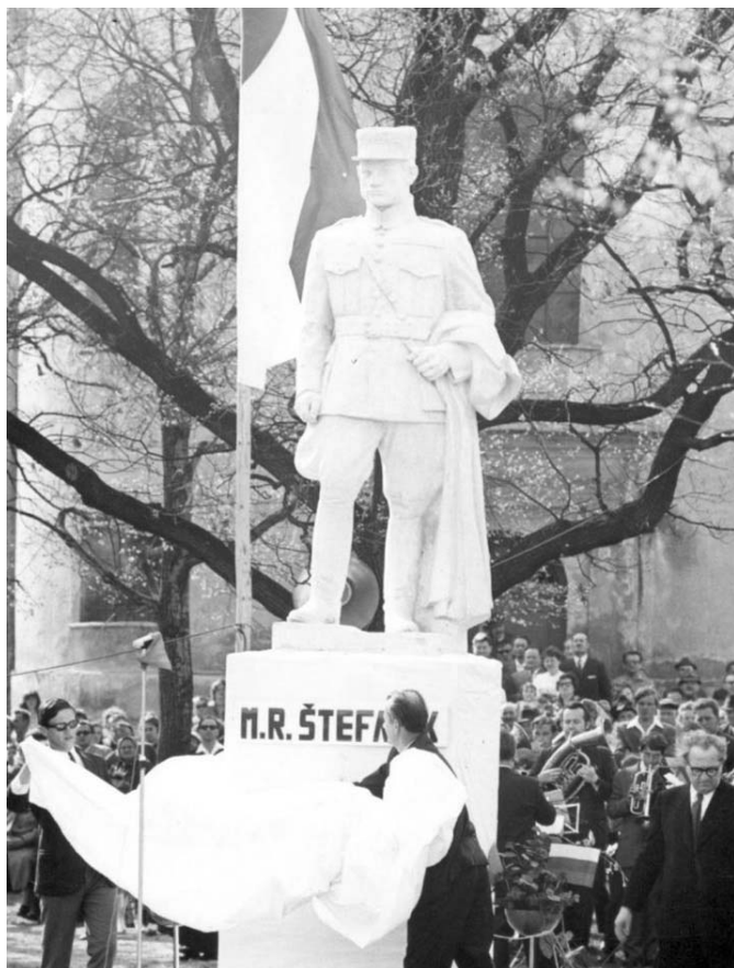
• Odhalenie sochy po jej premiestnení do parku pri evanjelickom kostole v r. 1968.

Dňa 4. 7. 2017 mestské zastupiteľstvo v Spišskej Belej schválilo vyhlásenie dobrovoľnej zbierky na znovuoobnovenie sochy gen. Milana Rastislava Štefánika v Spišskej Belej. V zmysle zákona č. 369/1990 Zb. o obecnom zriadení je tzv. dobrovoľná zbierka na znovuoobnovenie sochy Milana Rastislava Štefánika vyhlásená za nasledovných podmienok: