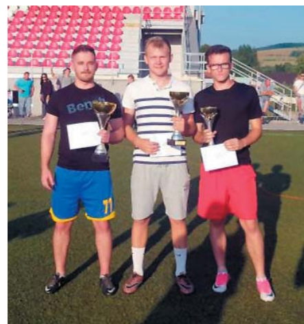
• Mesto Spišská Belá v spolupráci s MŠK Slavoj Spišská Belá zorganizovali aj tento rok obľúbenú súťaž v kopaní jedenástok Belianske jedenástky.