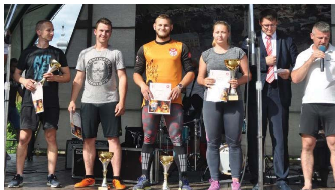
• Víťazi v súťaži Železný hasič.