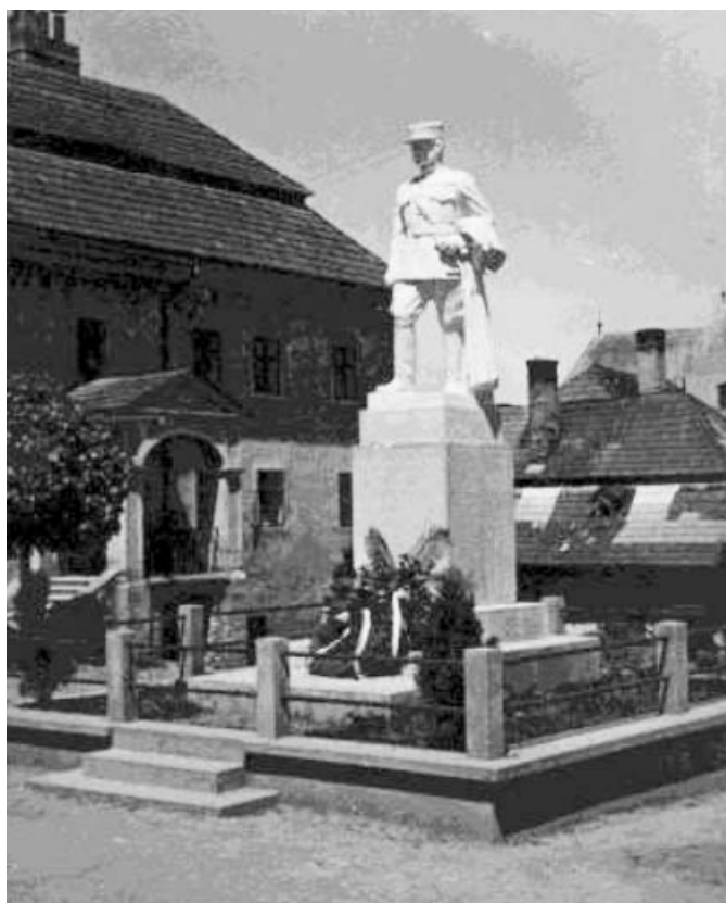
• Socha M. R. Štefánika pred mestským úradom.