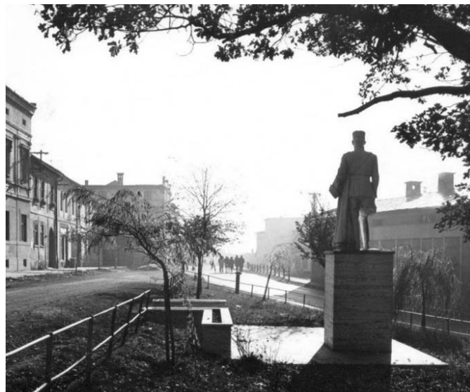
• Socha M. R. Štefánika v parku pri evanjelickom kostole.