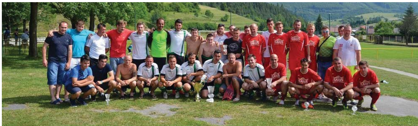
• Naši futbalisti MŠK Slavoj Spišská Belá sa v dňoch 24. - 25. júna zúčastnili Belá cup-u vo Valaskej Belej. Spišská Belá si napokon odniesla domov striebro.