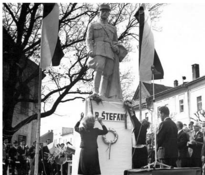
• Odhalenie sochy po jej premiestnení do parku pri evanjelickom kostole v r. 1968 bolo rovnako veľkolepé ako v r. 1939. Slávnostný program obohatilo aj vystúpenie Belianskej dychovky.