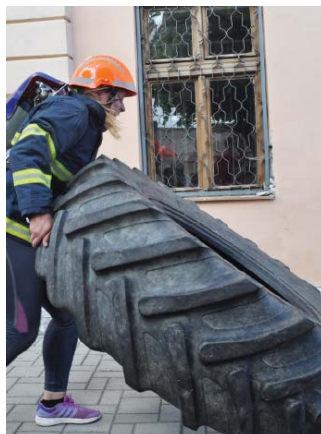
• Aj tento rok sa na námestí konala silová súťaž Železný hasič.