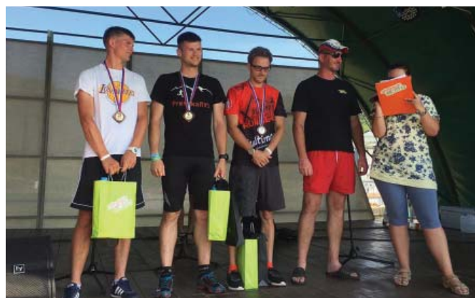
• Tohtoročné Jánske blato prilákalo rekordných 396 súťažiacich, ktorí si prišli zmerať svoje sily na 29 náročných prekážkach a trať dlhú cca 6 km.