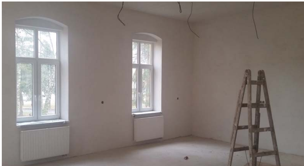
• Aj počas zimného obdobia pokračovali rekonštrukčné práce v budove pracoviska materskej školy na Letnej ulici. V najbližších týždňoch sa dokončia práce v interiéri a pokračovať budú stavebné práce na oprave fasády budovy vrátane zriadenia nových spevnených (prístupových) plôch pred budovou, tak aby na konci letných prázdnin bolo všetko pripravené na spustenie prevádzky.