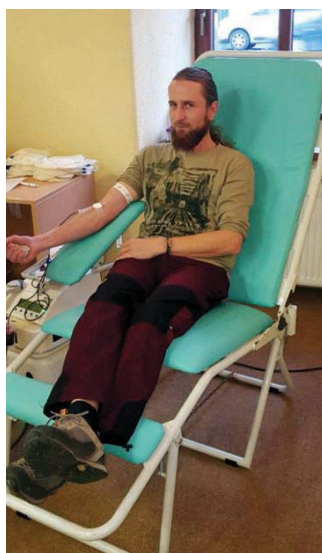
• Tohtoročná Valentínska kvapka kroi sa opäť tešila vysokej návštevnosti. Až 55 dobrovoľných darcov sa rozhodlo nezištne pomôcť.