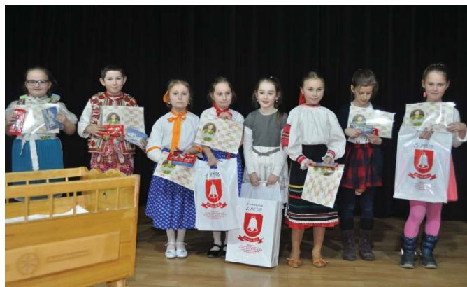
• Aj tento rok sa v Spišskej Belej konala detská spevácka súťaž Miss Bábika, ktorá má v našom meste niekoľkoročnú tradíciu. Súťaž v sebe nesie krásne poslanstvo, ktorým je udržiavanie folklóru a ľudových tradícií nášho regiónu a rozvíjanie lásky k nemu u našich najmladších.