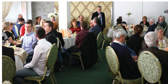
• Výrobné družstvo JAVORINA v Sp. Belej si pripomenulo na slávnostnej členskej schôdzi 70 rokov od svojho založenia. Pri tejto príležitosti sa stretli okrem vedenia družstva, aj bývalí a súčasní zamestnanci družstva.