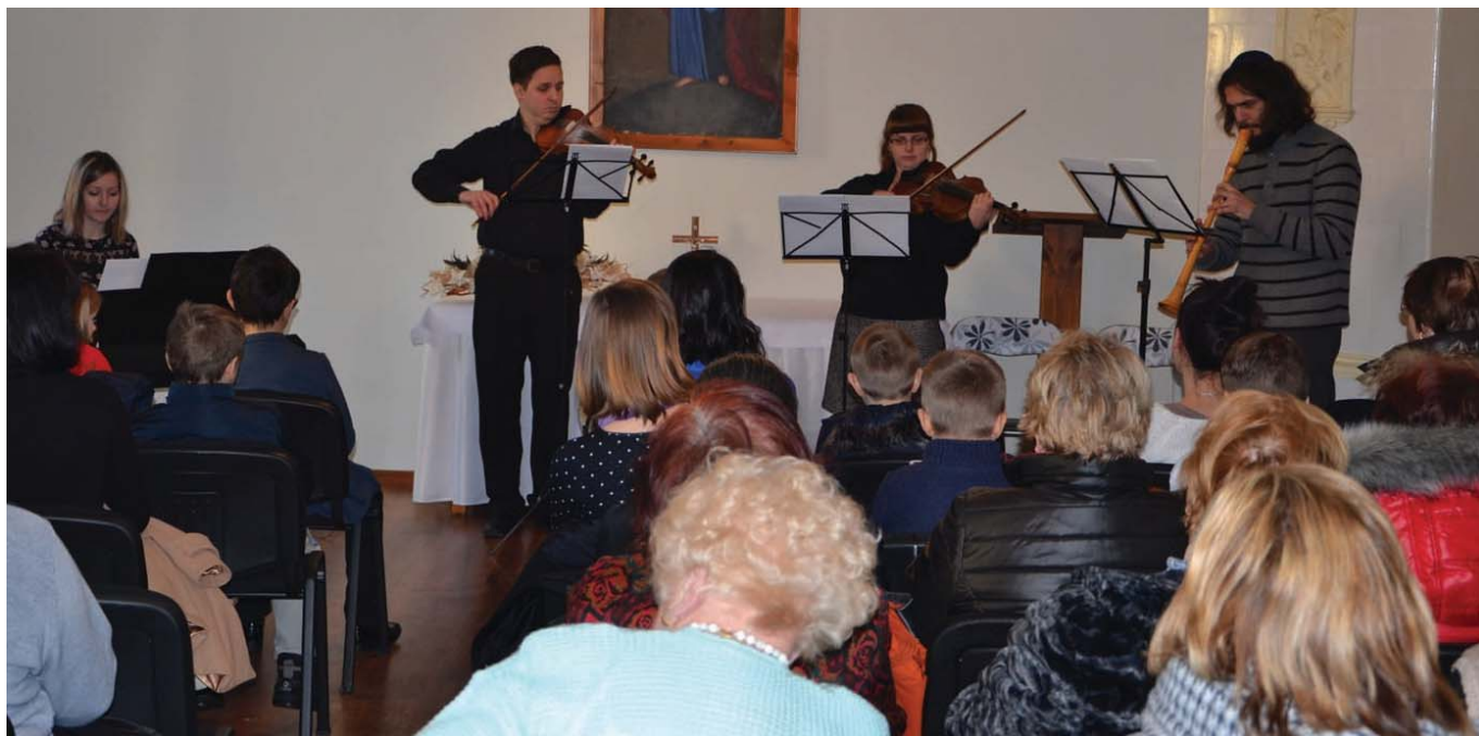
• O tom, že hudobné dedičstvo Spiša je mimoriadne bohaté sme sa mohli presvedčiť na Hauskonzerte Základnej umeleckej školy.