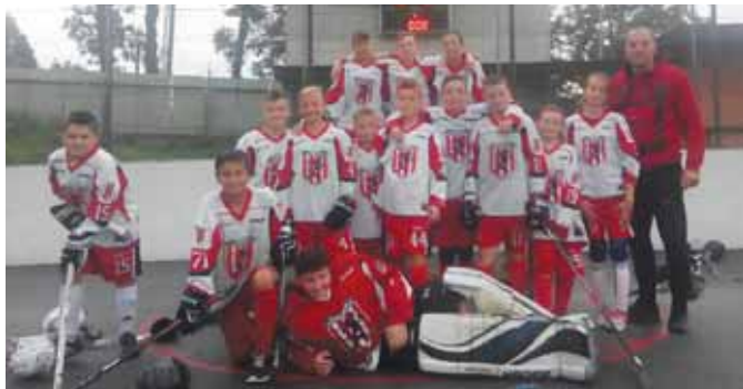
• Naši hokejbaloví mladší žiaci zahviezdili tromi víťazstvami aj na Morave.