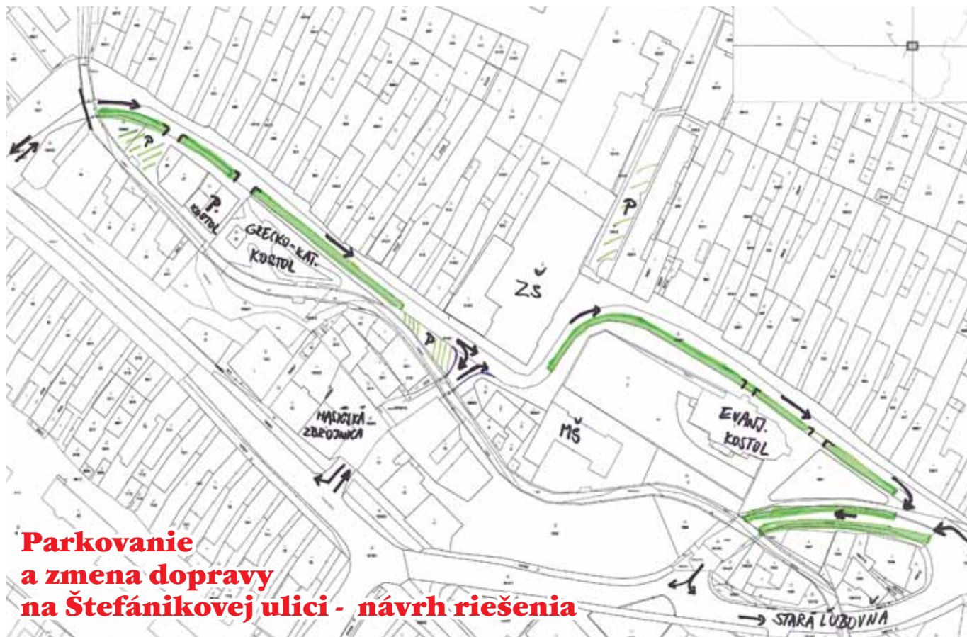
Parkovanie a zmena dopravy na Štefánikovej ulici - návrh riešenia