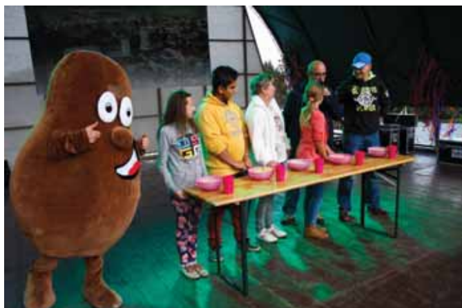
• Slovosolanum družstvo Spišská Belá usporiadalo zábavnú súťaž v jedení zemiakov.