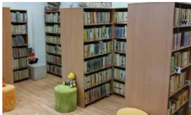
• Počas letných mesiacov prebehla v priestoroch mestskej knižnice jej rozsiahla rekonštrukcia. Túto rekonštrukciu najprv začalo mesto realizovať z vlastných financií z rozpočtu mesta, no nakoniec sa nám podarilo získať aj účelovú dotáciu zo štátneho rozpočtu.