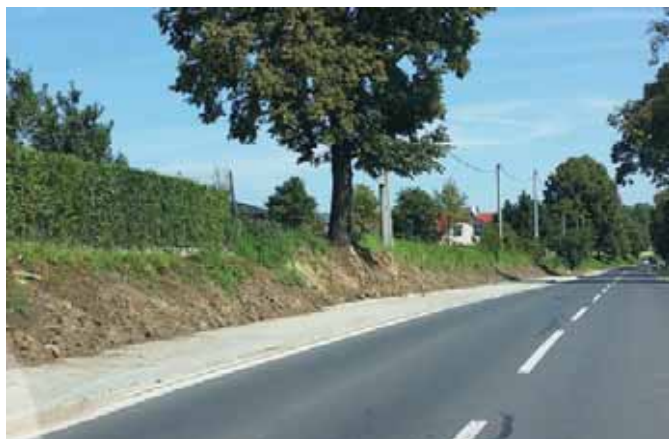
• Koncom leta mesto dokončilo výstavbu ďalšej časti chodníka v Strážkach popri štátnej ceste (asi najnebezpečnejší úsek v meste). Pod chodníkom sa nachádza nová dažďová kanalizácia na odvedenie povrchovej vody z cesty ako aj z okolitých polí. Celá táto stavebná akcia akcie stále takmer 50-tis. EUR a financovalo ju mesto zo svojho rozpočtu (z ušetrených zdrojov). Stavebné práce realizoval Mestský podnik Spišská Belá, s. r. o.