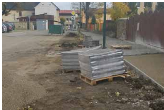
• Mesto začalo v októbri s realizáciou stavebnej úpravy chodníka a parkovania na Mierovej ulici (od škôlky po ul. 1. mája).