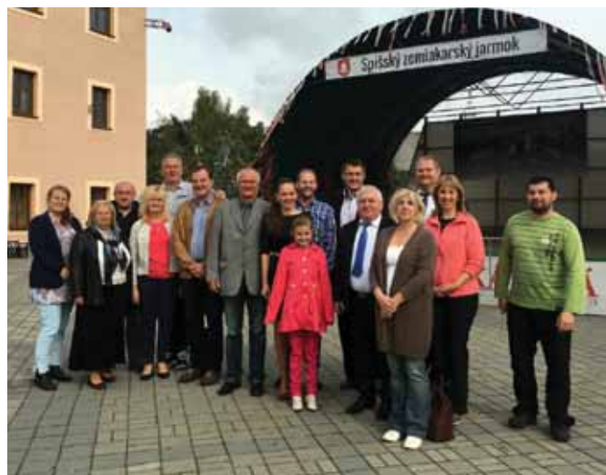
• Svojou návštevou nás počas jarmoku poctili i delegácie z našich partnerských miest v Poľsku, Česku a Nemecku.