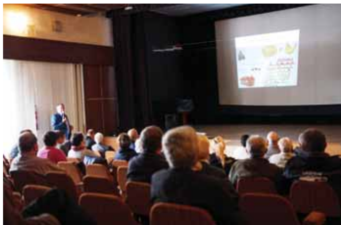
• Odborný seminár o pestovaní zemiakov, sliviek a chove králikov prilákal do kinosály mesta mnoho pestovateľov i chovateľov.