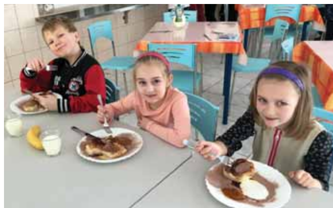
• Parené buchty s lekvárom na tradičný múčny piatok. V ten deň sa usmieva v jedálni každý.

Školská jedáleň na Štefánikovej ulici má dvere otvorené aj pre stravníkov s rôznymi tráviacimi ochoreniami, aj keď momentálne nemajú prihlásené žiadne deti s týmto problémom. „Snažíme sa vyjsť v ústrety všetkým. Ak by prišlo dieťa, ktoré takéto ochorenie má a mamička mu dá jedlo do obedára, radi mu ho prihrejeme. Ak by sa našla