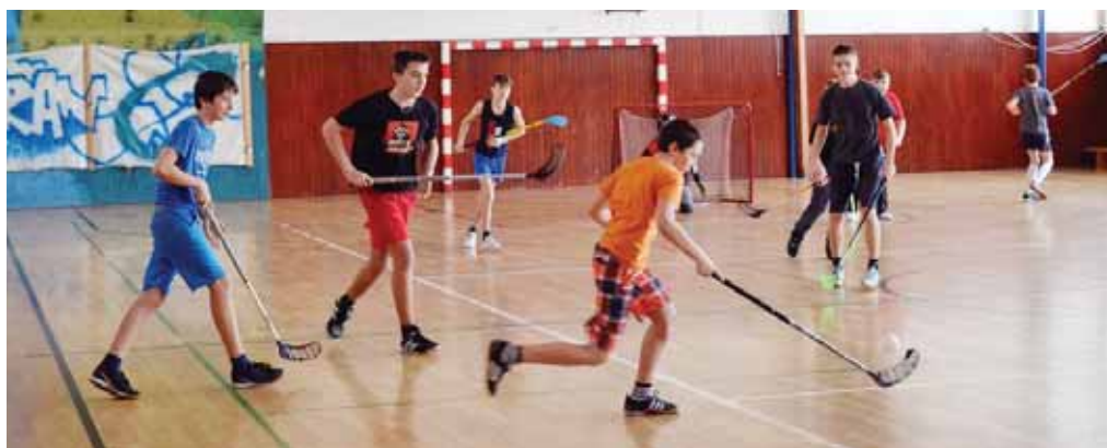
• Florbalový turnaj v telocvični ZŠ J. M. Petzvala.