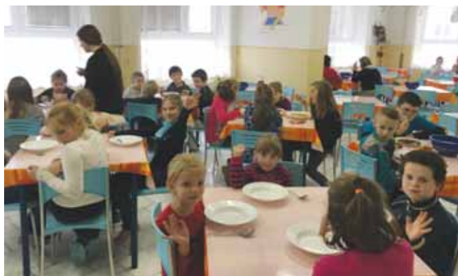
• Malí hladní stravníci zo školskej družiny.

Jedáleň je otvorená počas školského roku od pondelka do piatku v čase od 11.30 hod. – 14.00 h.