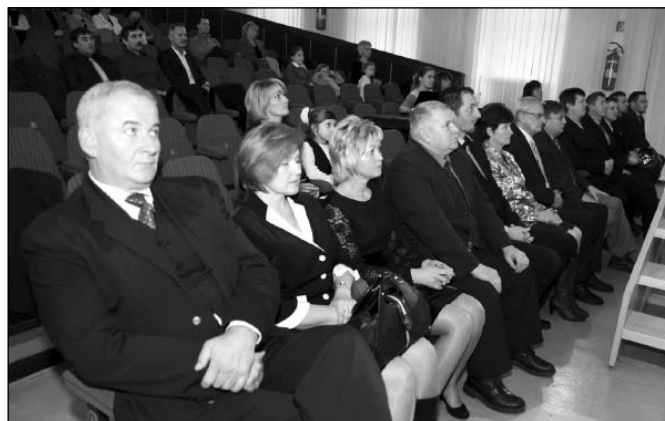
• Končiaci i novozvolení poslanci mestského zastupiteľstva počas slávnostného zasadnutia.