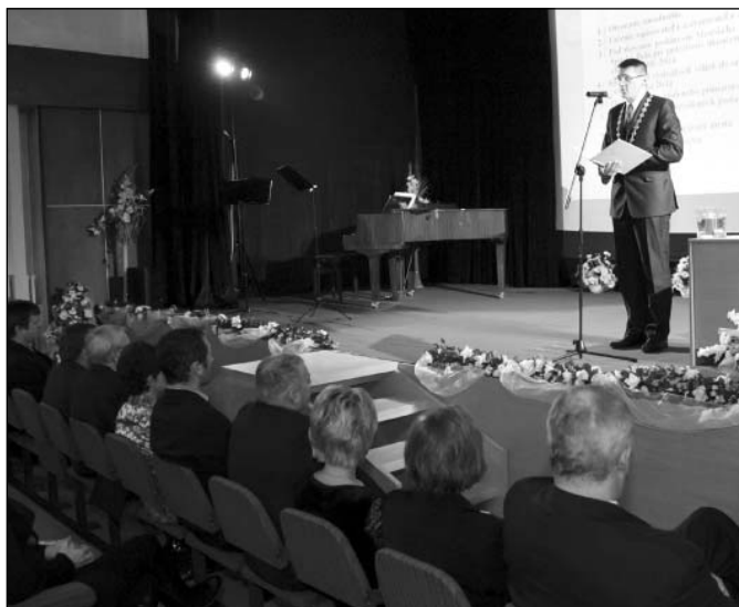
• Otvorenie rokovania ustanovujúceho zasadnutie Mestského zastupiteľstva v Spišskej Belej konaného dňa 14. decembra 2014.