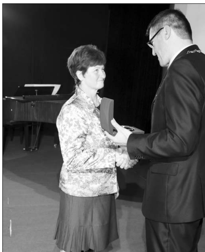
• Končiaci poslanci si prevzali z rúk primátora mesta pamätnú plaketu ako poďakovanie za výkon funkcie poslanca v období rokov 2010 - 2014.