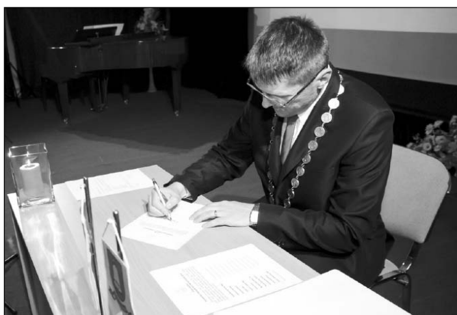
• Primátor mesta Štefan Bielač v rámci svojej inaugurácie do funkcie podpisuje sľub primátora.