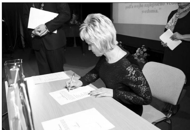
• Poslanci až podpisom svojho sľubu (jeho zložením) sa ujali svojej funkcie.