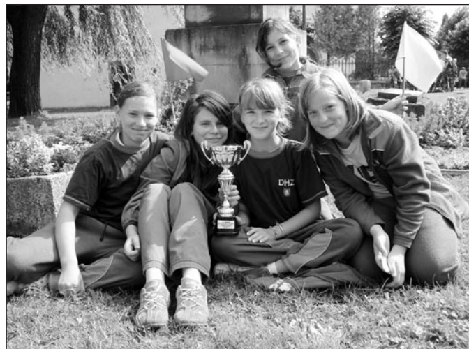
• Dievčatá z družstva Spišská Belá.