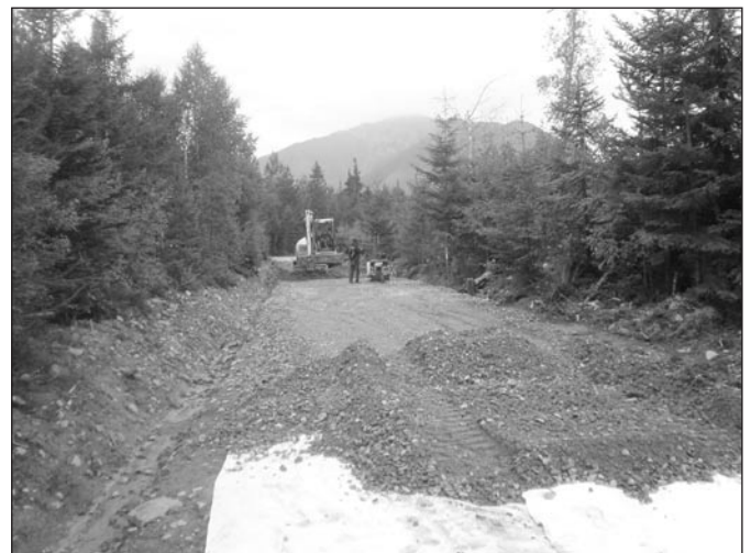
• Výstavba nových lesných ciest v mestských lesoch v lokalite nad Šarpancom.

Spracoval: Ing. Ján Majerčák, náčelník MsP