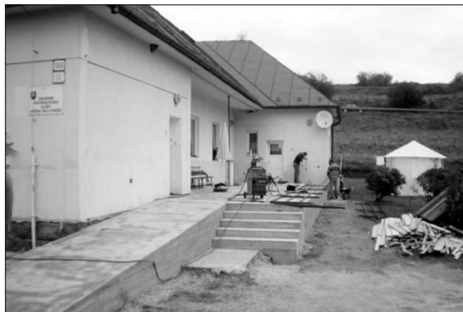
• Počas septembra a októbra prebehli stavebné úpravy v Zariadení opatrovateľskej služby v Strážkach. Z Ministerstva práce soc. vecí a rodiny SR mesto získalo dotáciu vo výške 6 000 eur na úpravu vstupu do budovy a zriadenie bezbariérového prístupu do tohto nášho zariadenia.

Prečo nie sú predmetom tohto projektu aj iné cesty, či chodníky? Ministerstvo výstavby a RR SR určilo podmienky pre podanie týchto projektov tak, že táto rekonštrukcia sa môže týkať len centra mesta v zmysle územného plánu mesta a zároveň určilo maximálny objem finančných prostriedkov, ktoré je možné žiadať na jeden projekt podľa veľkosti mesta. Preto projekt rieši vyššie uvedené časti mesta.