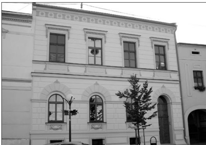
• Aj evanjelický farský úrad na Hviezdoslavovej ul. č. 16 prešiel rekonštrukciou a zvonku ho „zdobí“ nová strecha, okná a fasáda.