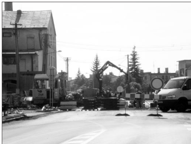
• V dňoch 19. - 21. septembra sa v Spišskej Belej uskutočnila výmena železničného priecestia pri čerpacej stanici OMV na štátnej ceste 1/67. Uvedené priecestie - koľajisko bolo už značne poškodené a jeho výmena bola nevyhnutná. Výmenu priecestia zabezpečila Slovenská správa ciest.

Všetkým menovaným boli odovzdané zaujímavé finančné ceny. Do súťaže sa zapojili len 11 súťažiacich. Primátor mesta vyjadruje poďakovanie všetkým, ktorí sa zapojili do tejto súťaže, za ich námahu a zároveň i odvahu.