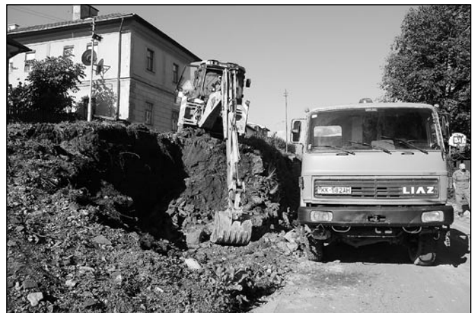
• V súčasnosti mesto realizuje plánovanú výstavbu nového oporného múru na Hviezdoslavovej ulici (v dolnej časti). Tento múr bol už v havarijnom stave a preto bolo potrebné ho úplne odstrániť a vybudovať nový oporný múr. Práce realizuje Mestský podnik Spišská Belá, s. r. o., a trvať by mali do konca októbra tohto roka.

aj slávnostné prijatie obyvateľov nášho mesta - jubilantov, ktorí v uplynulých 3 mesiacoch oslávili svoje okrúhle životné jubileum - narodeniny (70, 75, 80, 85, 90 a viac rokov). Jubilantom ako aj rodičom novonarodených detí bola odovzdaná kyticke kvetov, pamätné blahoželanie mesta a finančný dar.