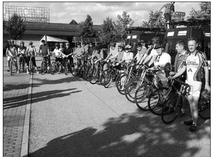
• Pred výjazdom na cykloexkurziu mestskými a prímestskými cyklotrasami mestečka Faenza.

slovenských zástupcov projektu boli aj cykloexkurzie uskutočnené priamo v teréne. Tu boli v praxi účastníkom predstavené rôzne typy cyklotrás a bolo poukázané na negatívne príklady pri ich tvorbe. Itinerár týchto exkurzií viedol od mestských a prímestských, cez tematicky orientované medziregionálne (Levanđuľová cesta) a horské cyklotrasy, až po cyklotrasy spájajúce mestá s prímorskými strediskami (Ravenna - Marina di Ravenna). Nechýbalo ani stretnutie s manažmentom liečebných kúpeľov Riolo Terme. Tie sú v Taliansku veľmi známe práve vďaka významným klientom z radov špičkových cyklistov.