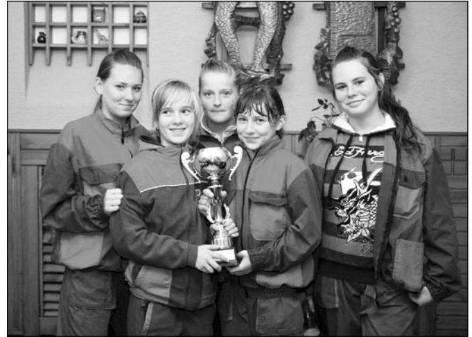
• Víťazné družstvá: 1. miesto - Vrbov - kategória chlapcov, 1. miesto - Spišská Belá - kategória dievčat.

a na treťom mieste družstvo z Vojnian s časom 105,28 s. V kategórii dievčat sa na prvom mieste umiestnilo domáce družstvo zo Spišskej Belej s výsledným časom 124,65 s, na druhom mieste družstvo zo Slovenskej Vsi s časom 131,86 s a na treťom mieste družstvo z Vrbova s časom 133,20 s. Víťazom odovzdal primátor mesta pamättné