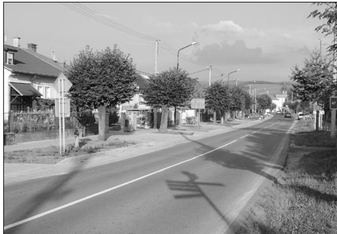
• Počas letných mesiacov mesto zrekonštruovalo aj vjazdy, vybuodovalo nový rigol na dažďovú vodu a upravilo trávniky na Ul. kpt. Nálepku.

Dňa 24. 8. 2010 sa uskutočnilo 7. zasadnutie Zastupiteľstva Prešovského samosprávneho kraja. Viac informácií získate na www.vucpo.sk