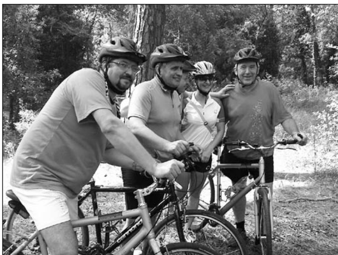
• Jedna z prestávok počas cykloexkurzie po prímorských cyklotrasách Marina di Ravenna.

Táto aktivita projektu bola financovaná Európskou úniou z prostriedkov Európskeho fondu regionálneho rozvoja a štátnym rozpočtom v rámci Programu cezhraničnej spolupráce Poľsko - Slovenská republika 2007 - 2013.