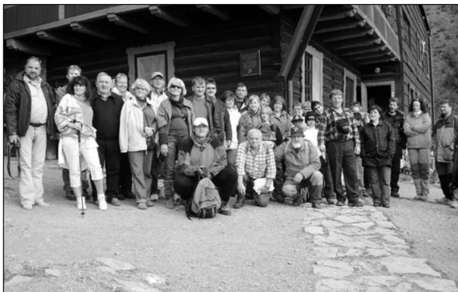
• Účastníci Belianskeho turistického pochodu pred chatou Plesnivec.

Účastníci pochodu si okrem príjemného pocitu z prechádzky v prírode, odniesli aj turistickú známku chaty Plesnivec, ktorá im bude túto vydarenú akciu pripomínať. Prírode zdar a na budúci rok opäť dovidenia.