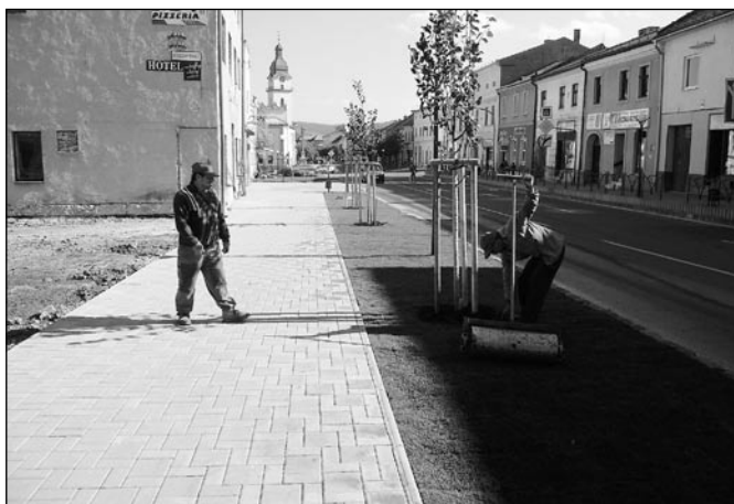
• Nový chodník s novým osvetlením, trávnikom a stromami na Petzvalovej ulici (1 - 9).