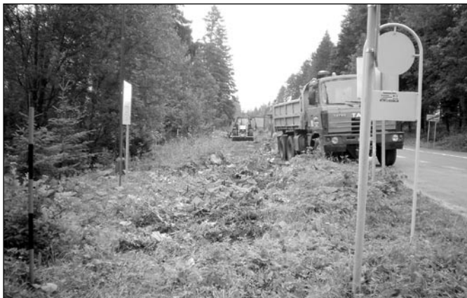
• Stavebné práce na cyklochodníku už pred Tatranskou Kotlinou.

Tento projekt je spolufinancovaný Európskou úniou z prostriedkov Európskeho fondu regionálneho rozvoja a štátnym rozpočtom v rámci Programu cezhraničnej spolupráce Poľsko - Slovenská republika 2007 - 2013.