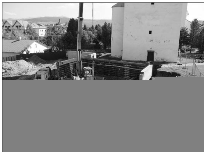
• Výstavba zhrmažďovacej plochy vedľa mestského úradu s podzemnými garážami a verejnými WC.