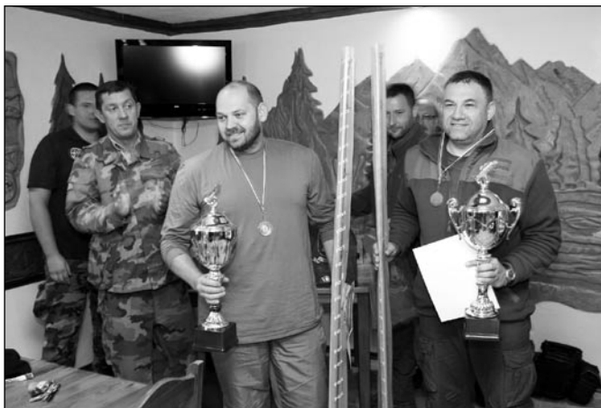
• Víťazi rybárskeho minimaratónu.

Centrum voľného času Spišská Belá, Zimná 47, tel. č.: 052/459 15 22, e-mail: cvcspbela@gmail.com, cvc@spisskabela.sk