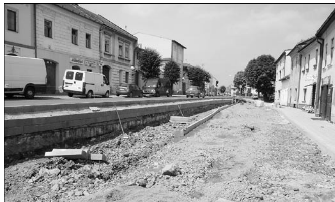
• Petzvalova ulica počas rekonštrukcie.

Pýtate sa, kedy bude dokončený chodník z prírodného kameňa na starom cintoríne. Pre tento rok mesto ešte koncom minulého roka naplánovalo realizáciu 1. etapy opravy chodníka vzhľadom na finančné možnosti rozpočtu mesta. Finančné prostriedky pre túto prvú etapu boli vyčerpané a dokončenie je naplánované na jar budúceho roka. Tak to bolo naplánované a v zmysle toho aj postupujeme a tak zostáva zrealizovať už menšiu časť uvedeného chodníka. Stavebné práce na 1. etape realizoval Mestský podnik Spišská Belá, s. r. o.