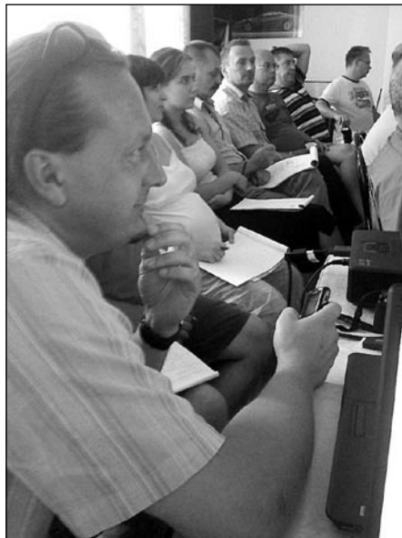
• Účastníci zahraničnej pracovnej cesty počas jedného z pracovných workshopov.