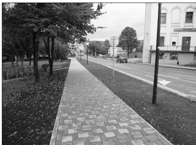
• Upravený chodník za lekárnou s novým osvetlením a novým trávnikom.

smerom k Slnčnej ulici s novým zábradlím. Rovnako začali práce na vybudovaní nového „malého“ námestia medzi úradom a zvonnicou s podzemným parkoviskom a s verejnými WC. V súčasnosti začali stavebné práce aj na novom chodníku na Slnčnej ulici a tiež na Hviezdoslavovej ulici. Tieto práce majú byť ukončené do konca novembra tohto roka. Tieto práce realizuje Mestský podnik Spišská Belá, s. r. o., a ARPROG Poprad, a. s. Ide o projekt finančne podporený z prostriedkov EÚ.