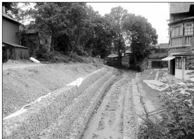
• Regulácia Belianskeho potoka v dolnom úseku prebieha vo veľmi zložitých priestorových podmienkach.