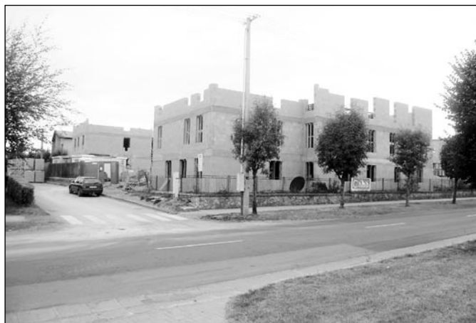
• Výstavba bytov do osobného vlastníctva na Zimnej 46 rýchlo napreduje. O podmienkach odkúpenia týchto bytov vás budeme informovať v ďalšom čísle spravodaja.

Prihlásiť sa osobne u jednotlivých vedúcich záujmových útvarov, prípadne v kancelárii CVČ na Mestskom úrade.