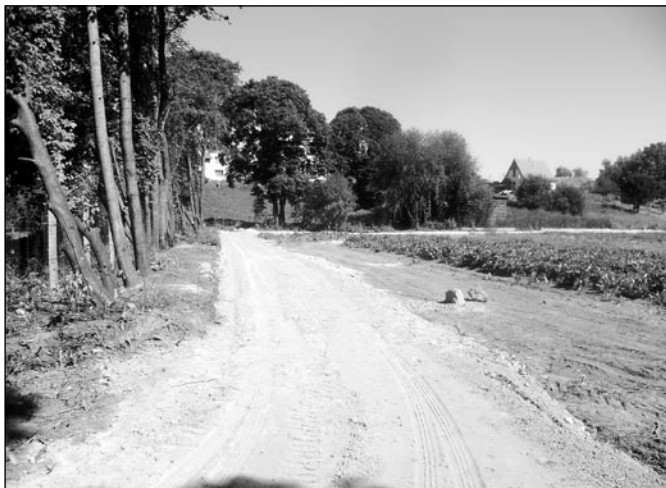
• Výstavba cyklotrasy v Strážkach pri kaštieli