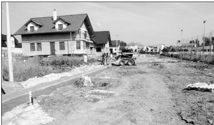
• V súčasnosti prebieha výstavba miestnej komunikácie aj na Agátovej ulici.

MsZ vzalo na vedomie informáciu primátora mesta o pokračovaní výstavby miestnej komunikácie na Lipovej a Agátovej ulici (doposiaľ ako IBV Športová) a o stavebnej úprave Športovej ulice (od ul. SNP). MsZ schválilo na tento účel zatiaľ 120-tis. eur v rámci zmeny rozpočtu mesta. Na túto akciu však budú však potrebné ďalšie finančné prostriedky, ktoré mesto bude musieť zabezpečiť v rozpočte mesta.