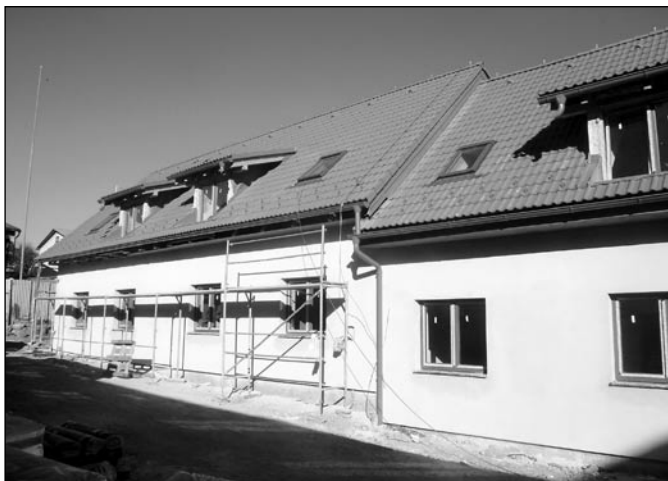
• Výstavba 17 nájomných bytov na Štefánikovej ulici č. 18 finišuje - byty by mali byť dokončené do konca novembra tohto roka.

Dopravný inšpektorát následne vozidlo zaeviduje a pridelí mu zvláštne evidenčné číslo, ktoré môže byť pridelené najviac na tri kalendárne roky a vydá mu osvedčenie. Žiadosť podlieha správne poplatku za jeden kus tabuľky s evidenčným číslom vo výške 33 eur. Takéto vozidlo bude možné používať na cestách III. triedy, miestnych komunikáciách a účelových komunikáciách za nezníženej viditeľnosti. Ak by občan potreboval vozidlo používať aj na iných cestách, musí požiadať dopravný inšpektorát o povolenie výnimky, ktorej vydanie je už bezplatné.