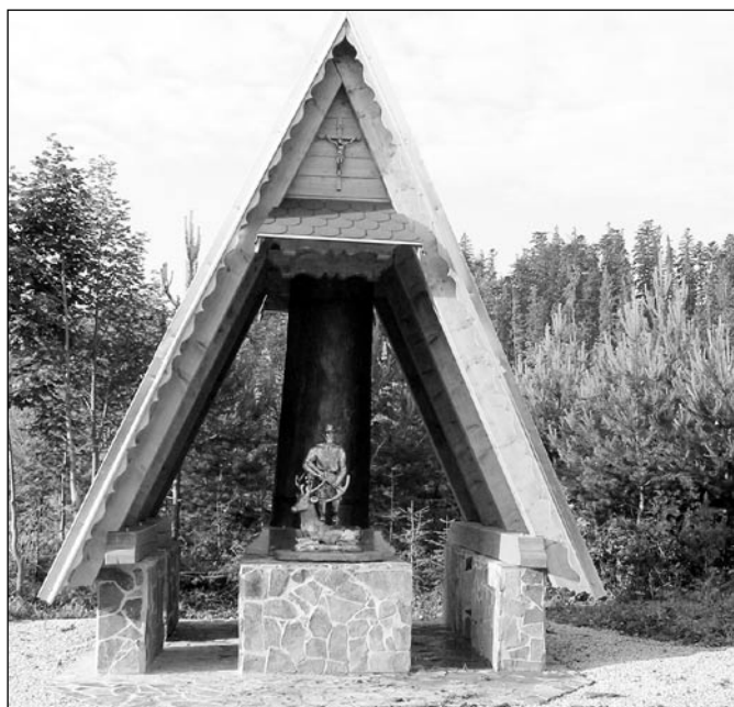
• Otvorenie lesníckeho náučného chodníka Flak s kaplnkou sv. Huberta v Tatranskej Kotline na starej kotlinskej ceste (na území našich mestských lesov). Viac informácií v budúcom čísle spravodaja.