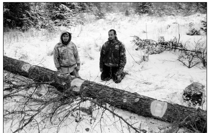
• Zadržaní obyvatelia rómskej osady Rakúsy pri krádeži dreva v mestských lesoch na Šarpanci.