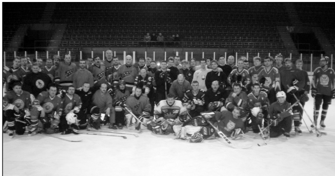
• Takmer všetci hráči Hokejového turnaja o pohár primátora nášho mesta.